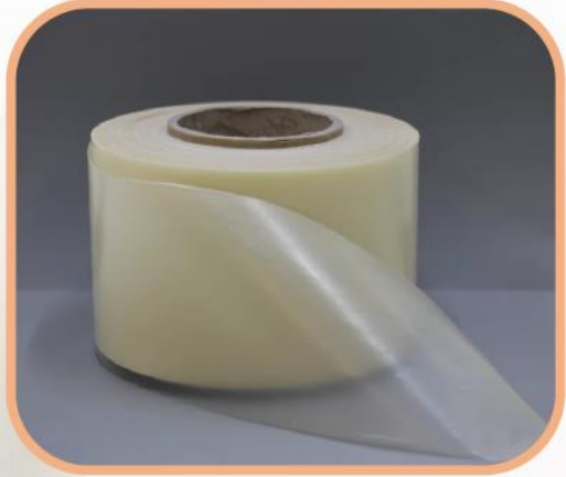
Film plastique innovant